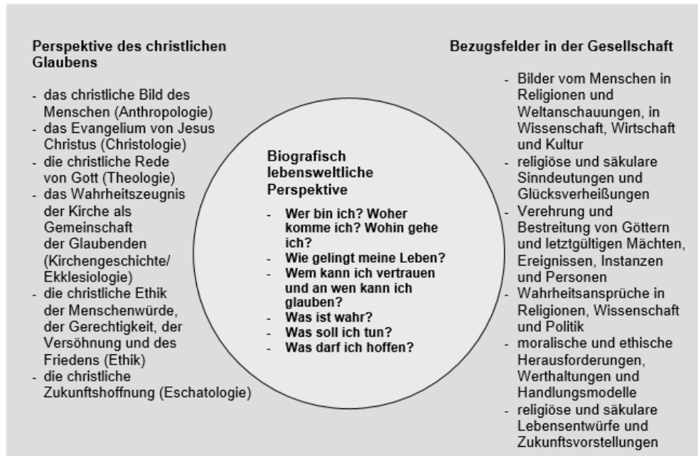
Abb. 3: Konzept grundlegender Wissensbestände für den Evangelischen Religionsunterricht an Sekundarschulen